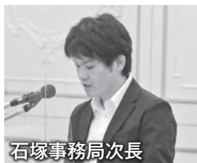
石塚事務局長次長