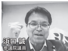
浜口 誠 参議院議員