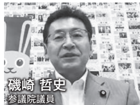
磯崎 哲史 参議院議員